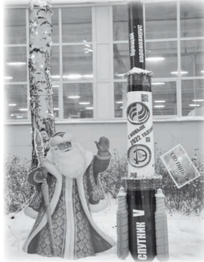
Победитель в номинации «Улётный коронавирус»