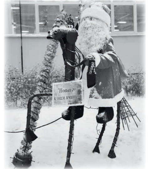
«Новый год к нам мчится»