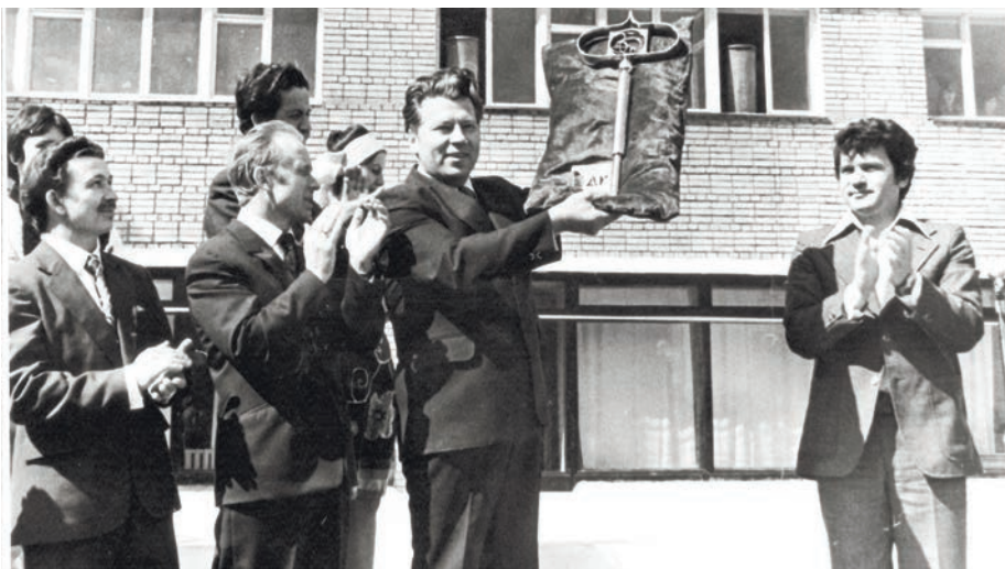
Открытие Дворца культуры ЗиО. 1977 год