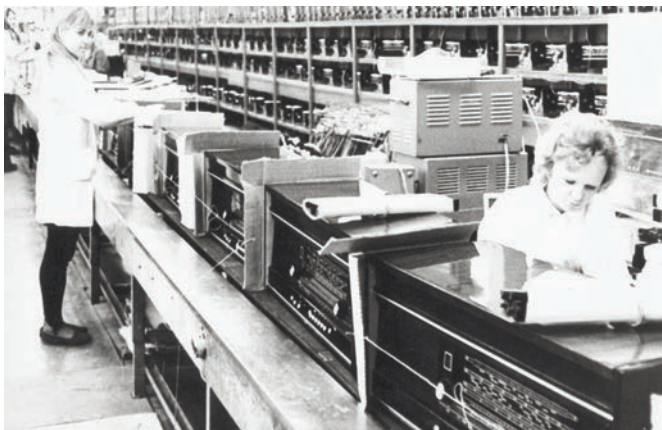
Участок упаковки радиолы «Урал-114».

– такой хороший звук даёт радиола КВ диапазона! Все-таки эта модель уникальна тем, что она была последней из ламповых радиол СССР.