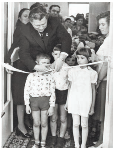
Открытие детсада №45 «Росинка» (сейчас Прогимназия № 10). 1980 год.

В 1978 году, буквально через год после его назначения, журнал «Радио» в отчёте о прошедшей в Москве ярмарке ведущих производителей страны сообщил о пополнении семейства отечественных радиол изделием «Урал-114» Сарапульского радиозавода. Современные радиолюбители, обсуждая технические характеристики изделия на своём форуме, сегодня делятся: «Услышав звуки этой радиолы, посетители комиссии ахнули: «Как же она прекрасно звучит! Вот умели делать раньше!». Невольные ценители «лампового» звука были поражены ещё раз