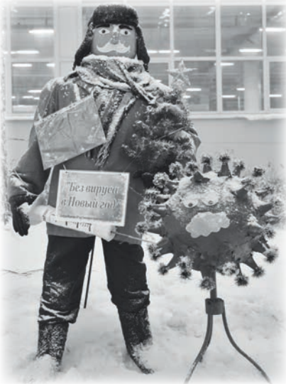
Победитель в номинации «Работник года»

Мы очень рады, что в этом конкурсе ежегодно принимают участие команды многих подразделений завода. Он стал доброй традицией на Сарапульском радиозаводе. Надеемся, что в следующем году креативных мастеров, желающих проявить свои таланты в нашем конкурсе, будет ещё больше.