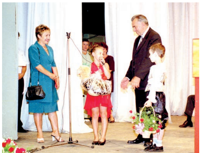
Поздравления с Днём завода от воспитанников детского дома. 2000 год