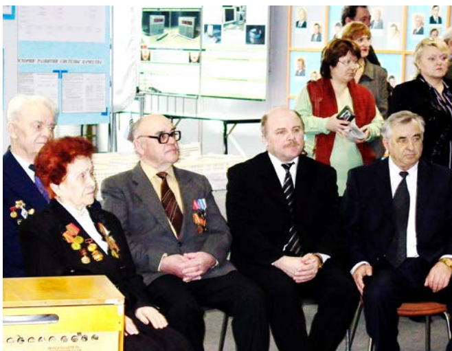
С ветеранами в музее завода. 2005 год