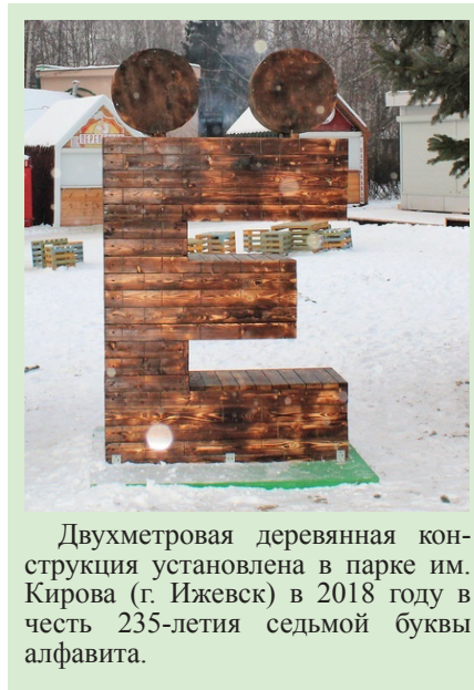
Двухметровая деревянная конструкция установлена в парке им. Кирова (г. Ижевск) в 2018 году в честь 235-летия седьмой буквы алфавита.