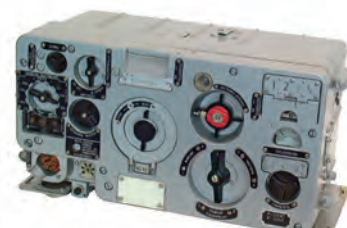
Радиостанция Р-123 «Магнолия»