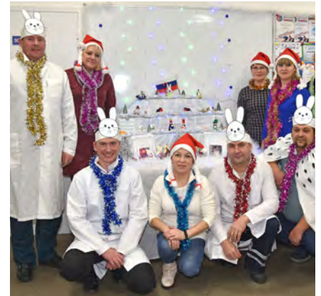
Монтажный участок КБ №62