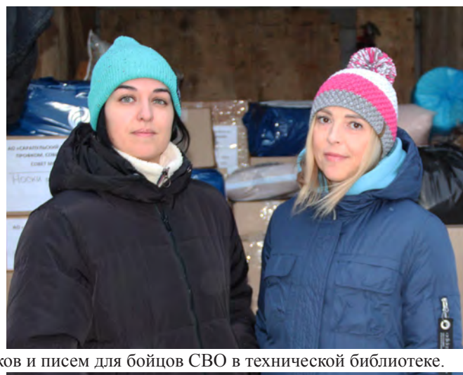
Сбор рисунков и писем для бойцов СВО в технической библиотеке.