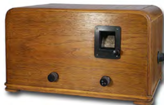
Приёмник «ЭЧС - 3»