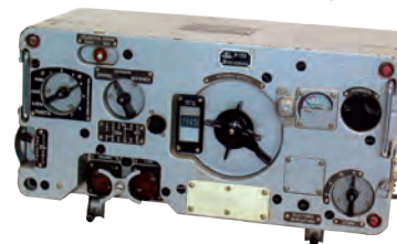
Радиостанция Р-113 «Гранат»